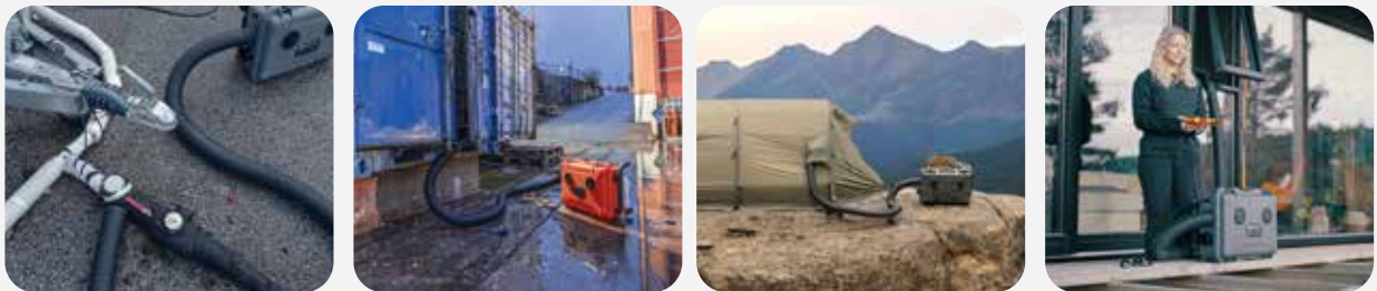
Oppvarming eller tining av vann og avløp, oppvarming av telt og oppbevaringssteder, hytter, eller som generell nødvarme.