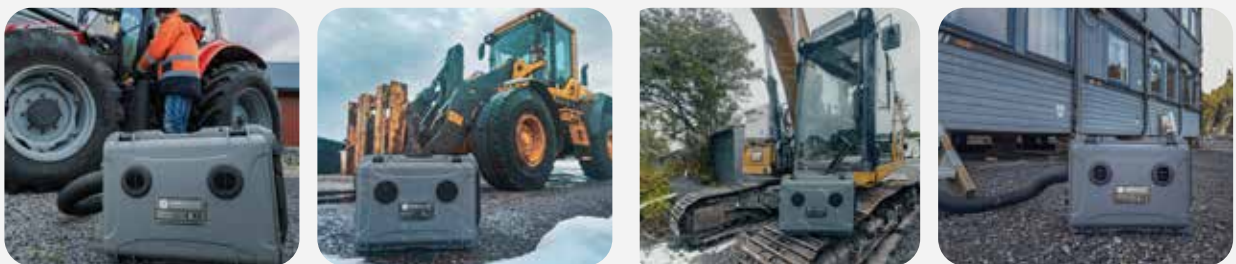
Oppvarming av dieselfilter, anleggsmaskiner, kupéer, brakkeanlegg, redskapsbu, containere og personvarme er bare noen av bruksområdene.

Maskinen må være tilknyttet 12V via kjøretøy, 12V via ekstern batteripakke eller 230V direktestrøm. Dette driver den innebyggede luftviften og brennerelementet. Maskinens drivstofftank rommer 7,5 liter drivstoff og varer helt opptil 3 døgn på laveste effekt (1kW). På full effekt (4kW) holder tanken til 16 timers kontinuerlig bruk.